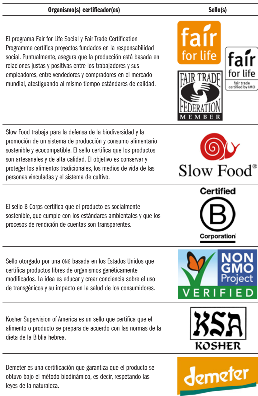
Tabla 3. Sellos complementarios a los orgánicos