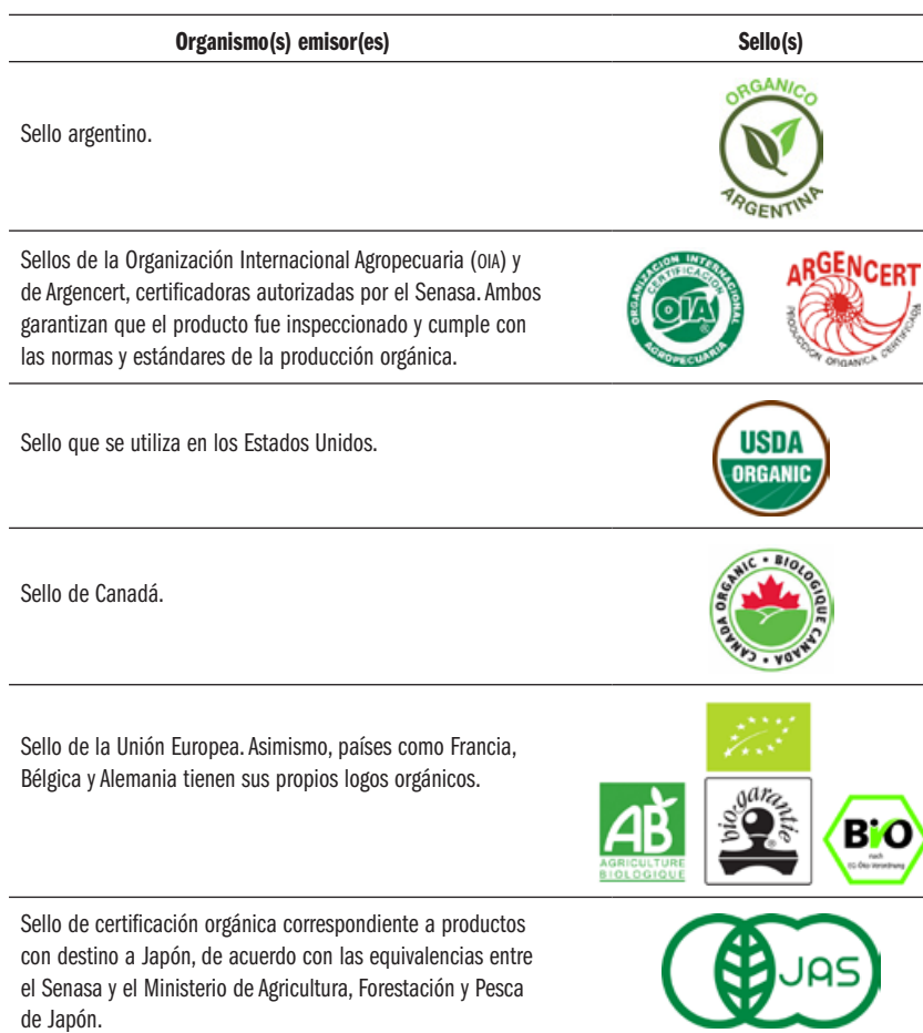
Tabla 1. Sellos de orgánicos en Argentina y destinos de exportación