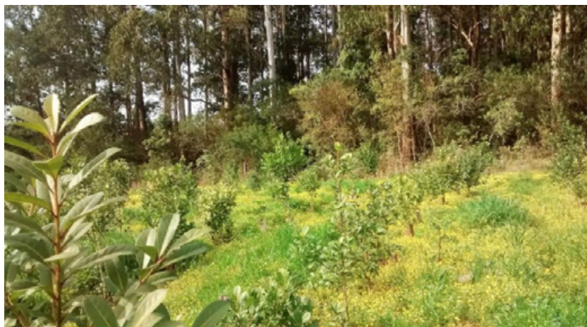
Figura 2. Nuevo yerbal orgánico en Ruiz de Montoya, Misiones. Pueden observarse las diferentes especies vegetales que cubren el suelo