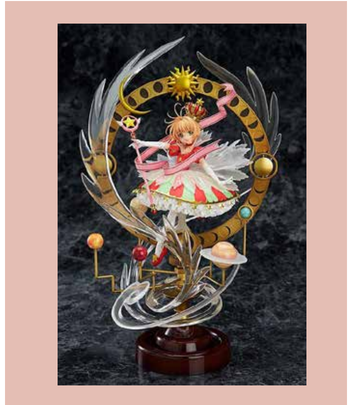
Fig. 7 Figura original de Sakura. Valor $20.900.