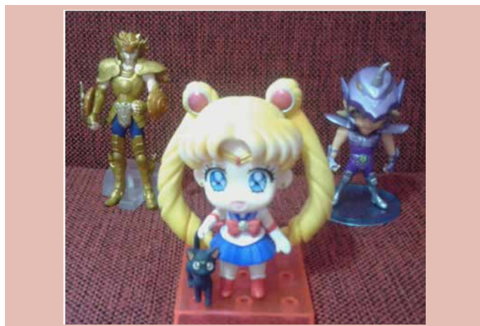
Fig.3. Figuras de Sailor Moon, Jabu, y Dohko de Libra.

La compra no se limita a la misma animación o a la historietita, el mercado está también centrado en el merchandising (legal e ilegal), localizado en tiendas online y físicas (Gastovic anime store, Beside C&T) en comiquerías ( La Revistería, Entelequia Comic Book Store, Elektra Comics, El club del cómic, Robot Negro ), en puestos de eventos, etc. Podemos mencionar algunos productos: pins, stickers, collares, pulseras, figuras, cartas, billeteras, ropa, figuritas, álbumes, mochilas, etc. Ver Figs. 3 a 8.