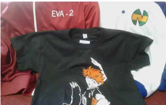
Fig. 6. Ropa no oficial de Evangelion, Hinata de Haikyuu y Captain Tsubasa.