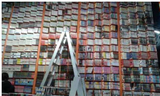
Fig. 2. La Revistería (local de calle Florida).

Sakura de IVREA Argentina está entre $ 395 y $ 450. 7