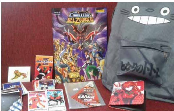
Fig. 5. Álbum y figuritas de Los Caballeros del Zodíaco de Panini Argentina, Cartas de Mazinger Z de Cromi, billetera de Evangelion, mochila de Totoro, bolsas para proteger los manga.