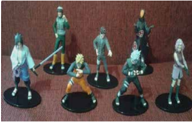
Fig. 4. Figuras Naruto Shippuden de Planeta.