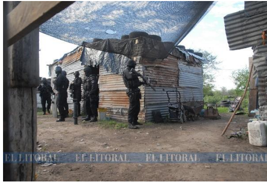
Figura 7.

Las fotografías recuperadas fueron tomadas por un reportero gráfico, según consta en las noticias. Se observa que se mostró a la policía armada como protagonista de la escena, mientras ingresaban a una vivienda precaria ubicada en un barrio vulnerable de la ciudad de Santa Fe.