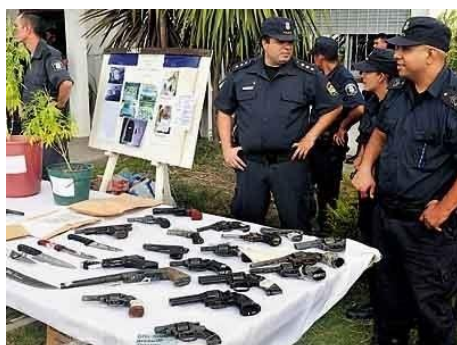
Figura 12.

Además, hay que agregar que el titular "Doscientos detenidos en megaoperativo" del 12/2/2011 de Diario Popular, estaba acompañado con la siguiente fotografía: