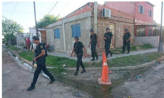
Figura 2. Fuente Aire Digital, 13/2/2019.

No se observó cita de la fuente de las dos fotografías recuperadas, rasgo que caracterizó prácticamente a todas las notas con imágenes de este medio. En un caso –que se recupera a continuación- se citó al Ministerio de Seguridad como “fuente”, y en otro se destacó que eran “imágenes suministradas por el Gobierno de la Provincia” (Aire Digital, 10/10/2018) 30 :