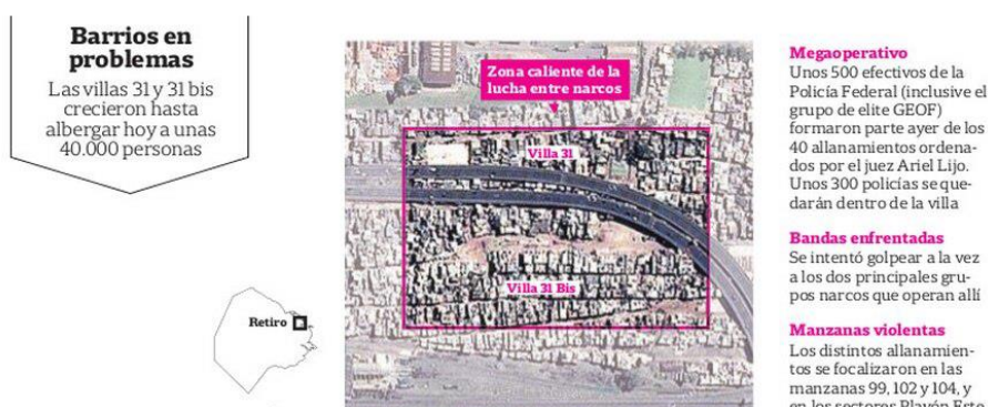
Gráfico 1.

La Nación utilizó fotos en la mayoría de sus noticias, y videos en algunas de ellas. En un solo caso, se utilizó una infografía, aunque sin interactividad, a diferencia de lo observado en otras investigaciones sobre medios digitales (Zunino & Grilli Fox, 2020):