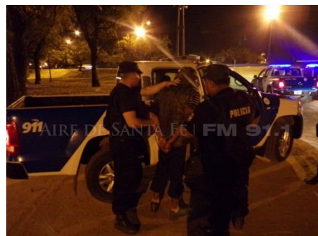
Figure 3. Fuente Aire Digital, 18/9/2016.

No se observó cita de la fuente de las dos fotografías recuperadas, rasgo que caracterizó prácticamente a todas las notas con imágenes de este medio. En un caso –que se recupera a continuación- se citó al Ministerio de Seguridad como “fuente”, y en otro se destacó que eran “imágenes suministradas por el Gobierno de la Provincia” (Aire Digital, 10/10/2018) 30 :