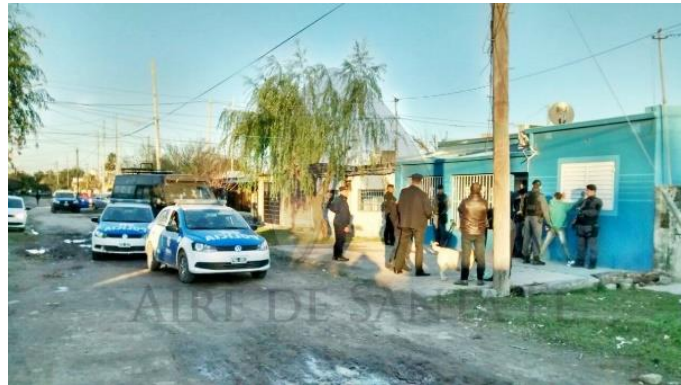
Figura 1. Fuente Aire Digital, 6/6/2016.

personal policial que realizaba chequeos de personas o patrulla en el territorio. Podemos ilustrar lo enunciado con las siguientes imágenes: