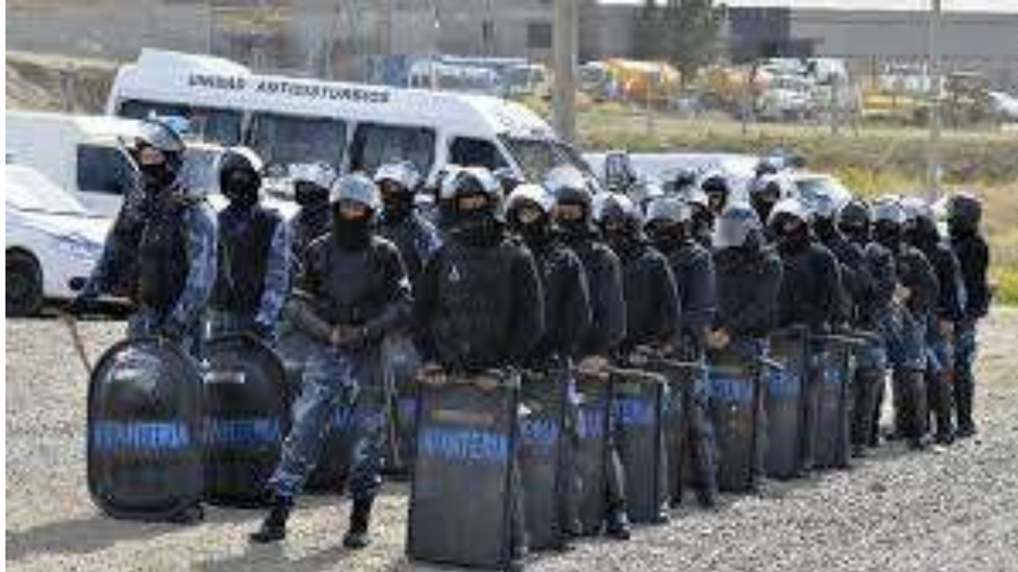
Un cuerpo de la guardia de infantería apostado, listo para actuar en un corte de ruta. 28

A esta presencia, de por sí ya intimidante, se le sumaban las de las fuerzas ordinarias que, al habitual patrullaje a pie, se le sumó en los años siguientes el establecimiento de garitas fijas en determinados puntos del centro de la ciudad, estilo panóptico, instaladas a cierta altura y en lugares estratégicos de mayor circulación de personas.