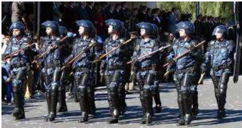
Guardia de infantería división femenina

Así, se hizo habitual observar en pleno centro a grupos especializados de la policía de la provincia realizando recorridos de prevención. Otro ejemplo que ilustra esta decisión política se evidenció cuando la vigilancia en bancos empezó a ser realizada por personal de la división “GUARDIA DE INFANTERIA”, con sus trajes característicos tipo camuflaje de color azul y celeste, armas largas y con identificación visible. En general, al ser el grupo de “choque” que interviene en manifestaciones, cortes de ruta y disturbios por parte de grupos o muchedumbres, no era habitual verlos en el casco céntrico y mucho menos con su identificación visible ejerciendo tareas de prevención