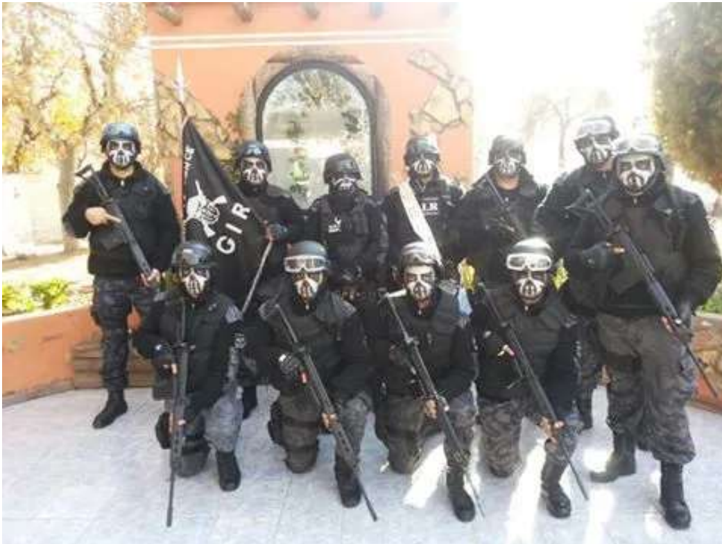
Imagen del grupo de intervención rápida (GIR).

Existe además en la policía de la provincia, un “cuerpo de elite” denominado “G.E.O. KUNTUR”. Según la propia descripción que se realiza de este cuerpo en la página de la policía de Catamarca, intervienen en: “Crisis con Toma de Rehenes; Allanamientos Complejos; Custodias Especiales; Traslados de Detenidos Peligrosos; Control Vehicular en Búsqueda de Delincuentes Peligrosos; Búsqueda y Rescate de Personas Extraviadas”. En la práctica sus intervenciones son conocidas por llevar adelante allanamientos sumamente violentos y junto con el grupo GIR y el grupo KAPPA son los grupos especiales que los jóvenes de los barrios marginales identifican como los más “verdugos”, ya que refieren son quienes llevan adelante con mucha más impunidad y ensañamiento, diversas prácticas de violencia sobre ellos, desde hostigamientos verbales, detenciones arbitrarias, apremios y prácticas de tortura (submarino 29 , submarino seco 30 , picana eléctrica 31 , golpes, quemaduras, abusos sexuales,