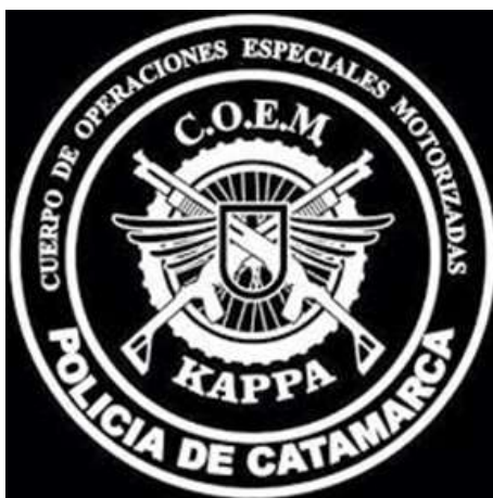
Imágenes del logo del Cuerpo de Operaciones Especiales Motorizadas y su vestimenta 27