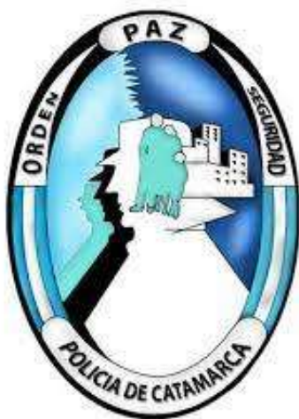
Logo de la Policía de Catamarca

“El mantenimiento del orden constituye una función típica del gobierno. No sólo la legitimidad del gobierno está en gran medida determinada por el hecho de que éste mantenga o no el orden, sino que el orden constituye un criterio por el cual se determina, en primer lugar, si un gobierno dado en efecto existe.” (p. 17)