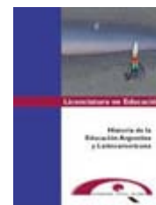
Ilustración de esta página extraída de: Tapa de la primera edición de la carpeta de trabajo Dabat, R. (1999). Historia de la Educación Argentina y Latinoamericana . Universidad Virtual de Quilmes.

Granero, L., & Scarcela, R. (2014). Sistema Educativo: cambiar la mirada, desnaturalizar lo escolar... de eso se trata. Sociales y Virtuales , 1 (1). Recuperado de < http://socialesyvirtuales.web.unq.edu.ar/articulos-de-los-estudiantes/sistema-educativo-cambiar-la-mirada/ >